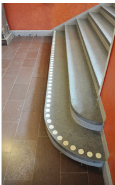
Känslig gammal miljö, men Utvägen är van att göra passande lösningar i sådana miljöer.