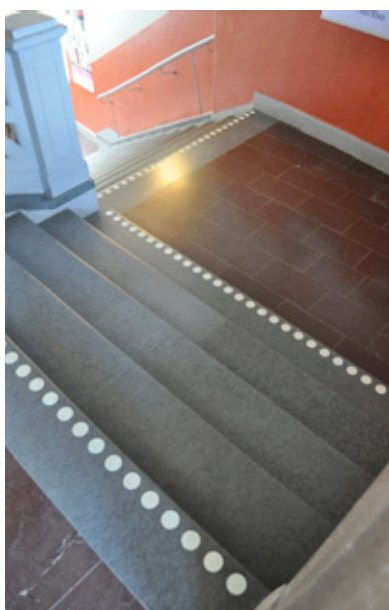
Hersby gymnasium på Lidingö. Här trampar 600 elever trapporna flera gånger om dagen.