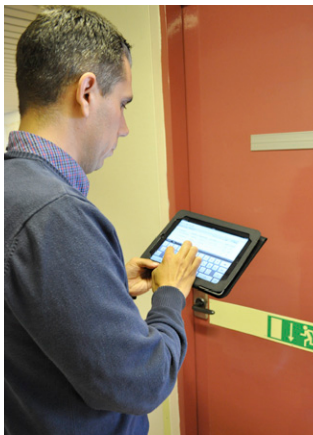
Zu Casa på läsplatta fungerar lika bra om man är på platser som saknar uppkoppling. När man får kontakt med nätet igen uppdateras alla uppgifter.