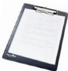
Analogt har blivit digitalt. Den gamla skrivplattan heter nu läsplatta, även om den också går att skriva på.

Numera är det en självklarhet att kunna arbeta mobilt, eftersom var och varannan