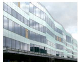
Malmö högskola har 25 000 elever.

Där kunde medarbetarna se hela kursutbudet och vilka datum som fanns tillgängliga. Sedan var det bara att anmäla sig till kursen genom att fylla i namn och kontaktuppgifter.