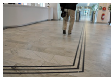
Ledstråk på Lidingö stadshus.