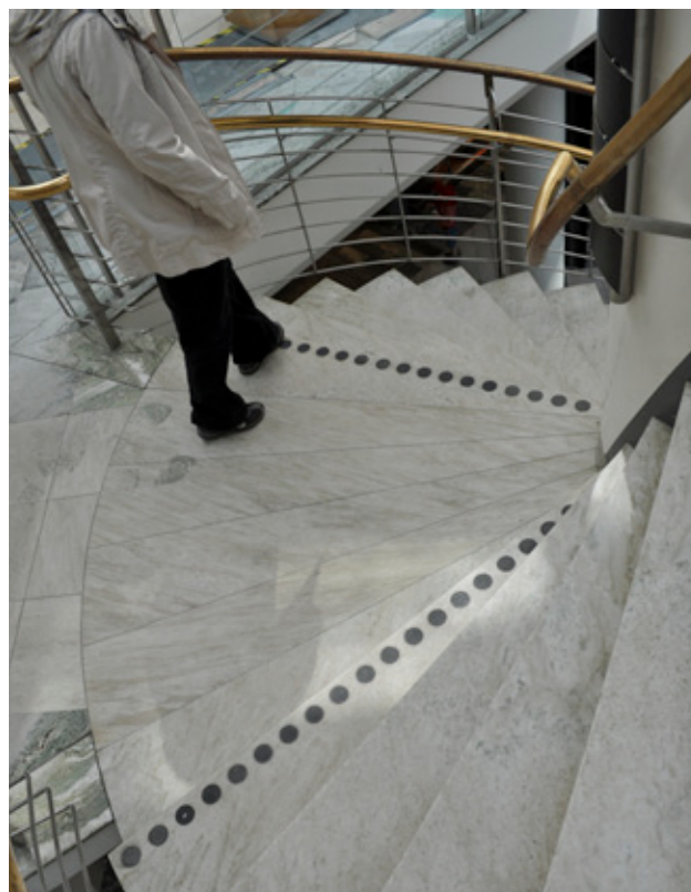
Alla 50 miljoner besökare kanske inte går i trapporna, men åtskilliga har det blivit genom åren och ändå är prickarna i mycket gott skick.