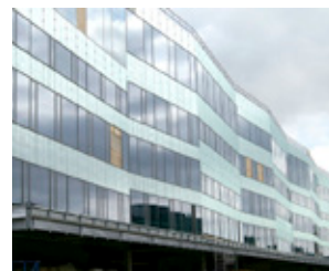
Malmö högskola har 25 000 elever.

Där kunde medarbetarna se hela kursutbudet och vilka datum som fanns tillgängliga. Sedan var det bara att anmäla sig till kursen genom att fylla i namn och kontaktuppgifter.