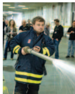
Det finns tillgång till vattnet på utsidan av skrovet via en pump.