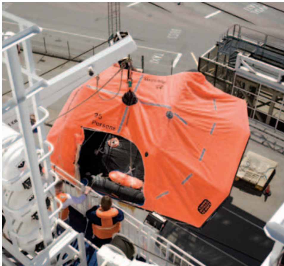
Ombord på m/s Gabriella finns 65 stycken livräddningsflottar. Varje flotte tar 25 personer. Dessutom finns sju livbåtar i olika storlekar. De största tar 150 personer.