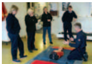
Många kan räddas efter hjärtstopp.

– Tidigare tog HLR och första hjälpen en dag i anspråk, nu räcker det med en halvdag för bägge utbildningarna. ◀