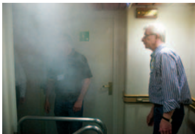
Att själva få erfara panikkänslan som kryper på i en rökfylld korridor tyckte många var en nyttig erfarenhet.