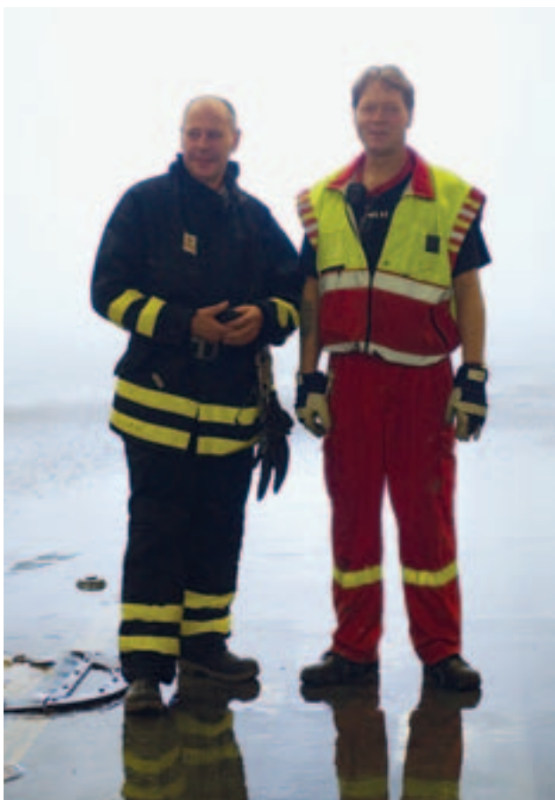
Varje fartyg har till och med en egen brandkår. ”Brandmännen” är vanliga besättningsmän som utbildas under ledning av Räddningstjänsten.