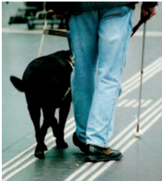
Människor med nedsatt syn ska kunna orientera sig lättare med Utvägens nya markeringar.

Enligt regeringsförordningen från 2001 ska alla offentliga platser och byggnader vara tillgängliga för alla medborgare. Det innebär till exempel att människor som använder rullstol ska kunna ta sig fram, att människor med nedsatt syn ska kunna orientera sig och att människor med nedsatt hörsel ska kunna delta i verksamheten.