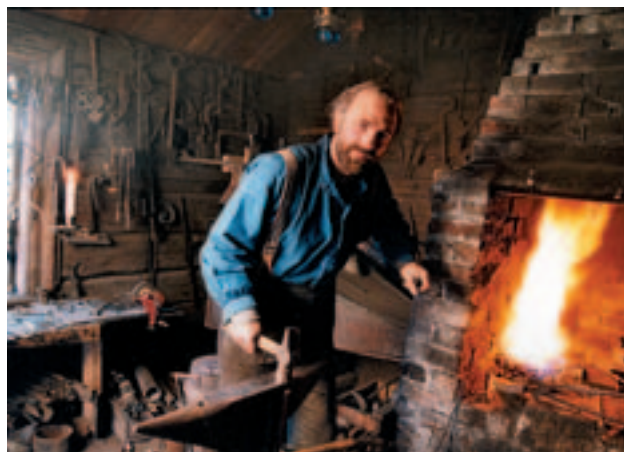
Utvägen utbildar personal på Skansen.