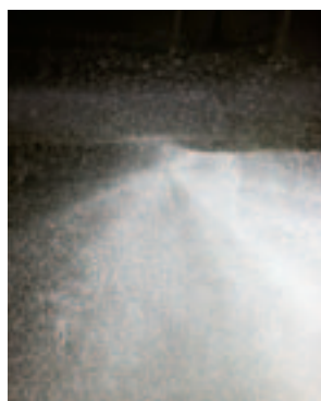
Sprinklers i taket lägger som en ridå av vatten över bildäck.